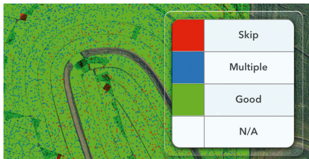
Lavoura plantada em 2014 com dosadores convencionais. A média de singulação foi de 96,2%, sendo falhas 1,5% e duplas 2,3%.

Compare este campo plantado em 2014 com dosadores convencionais com o mesmo campo em 2016 plantado com dosadores vSet®. O plantio passou de 96,2% para 99,7% de singulação. Em 2,5 sc/ha por ponto percentual, temos um incremento de 8,75 sc/ha, apenas mudando o seu dosador.